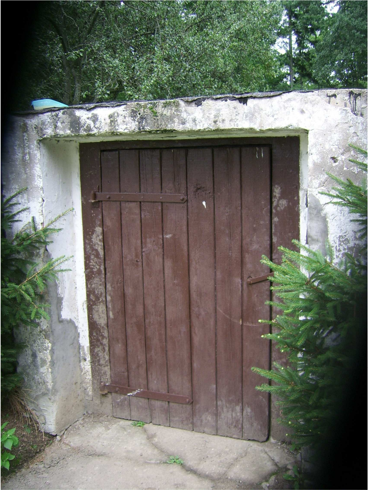
Ryc. 7 Obiekt nr 43