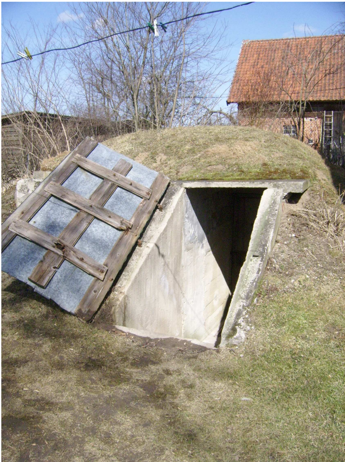
Ryc. 11 Obiekt nr 4