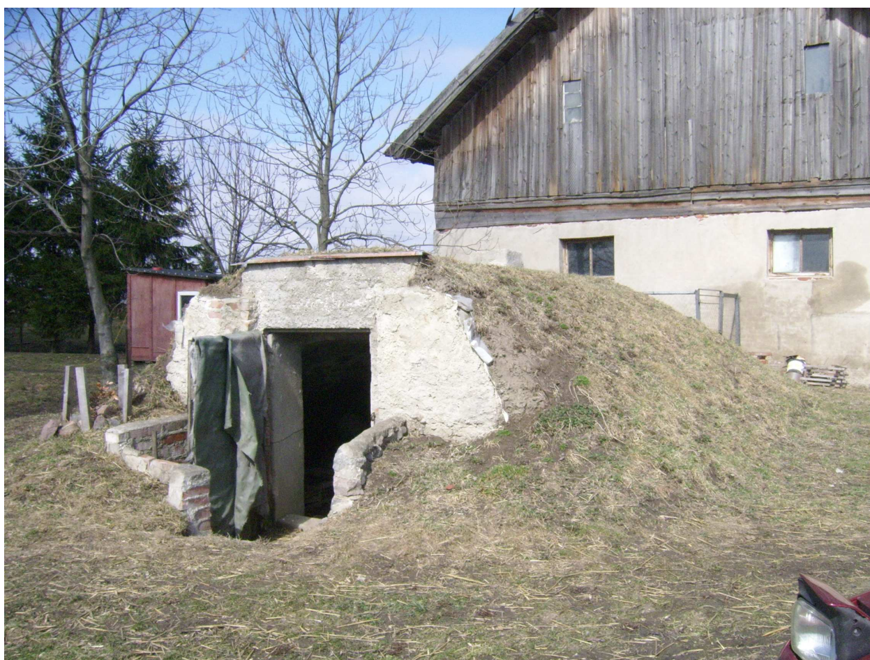
Ryc. 13 Obiekt nr 9