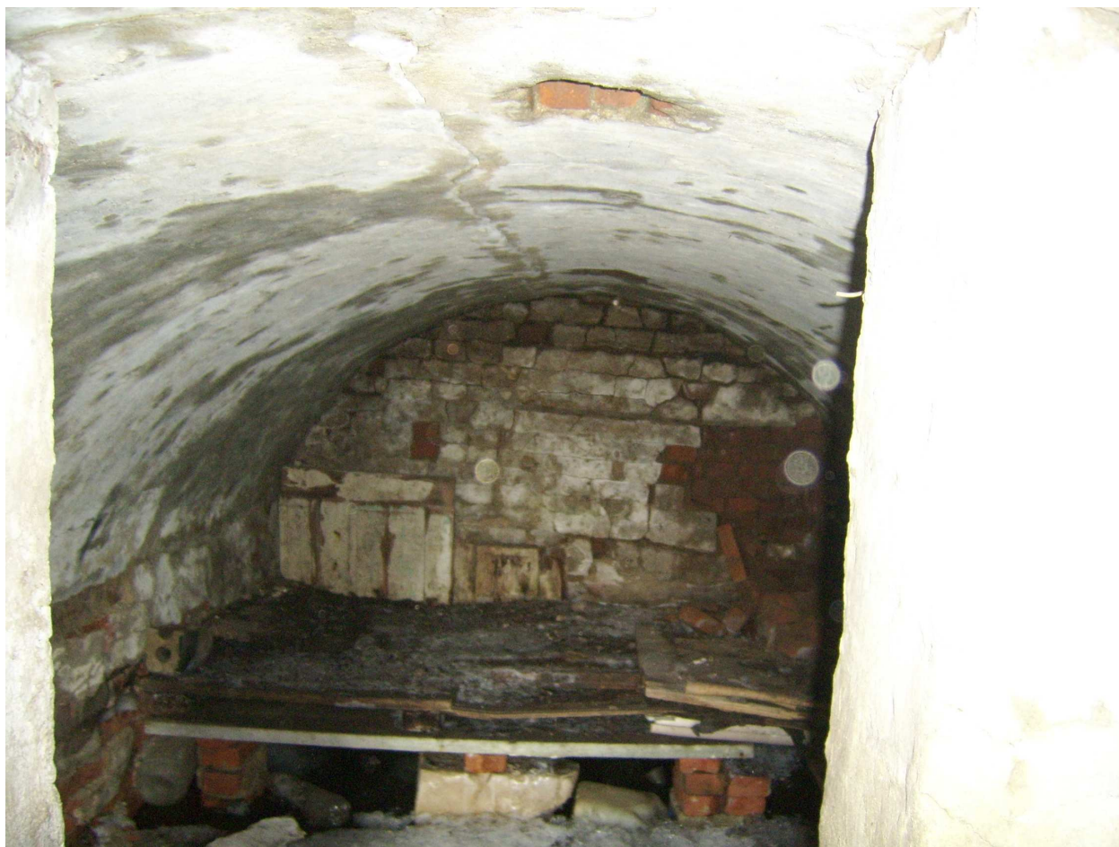
Ryc. 12 Obiekt nr 7