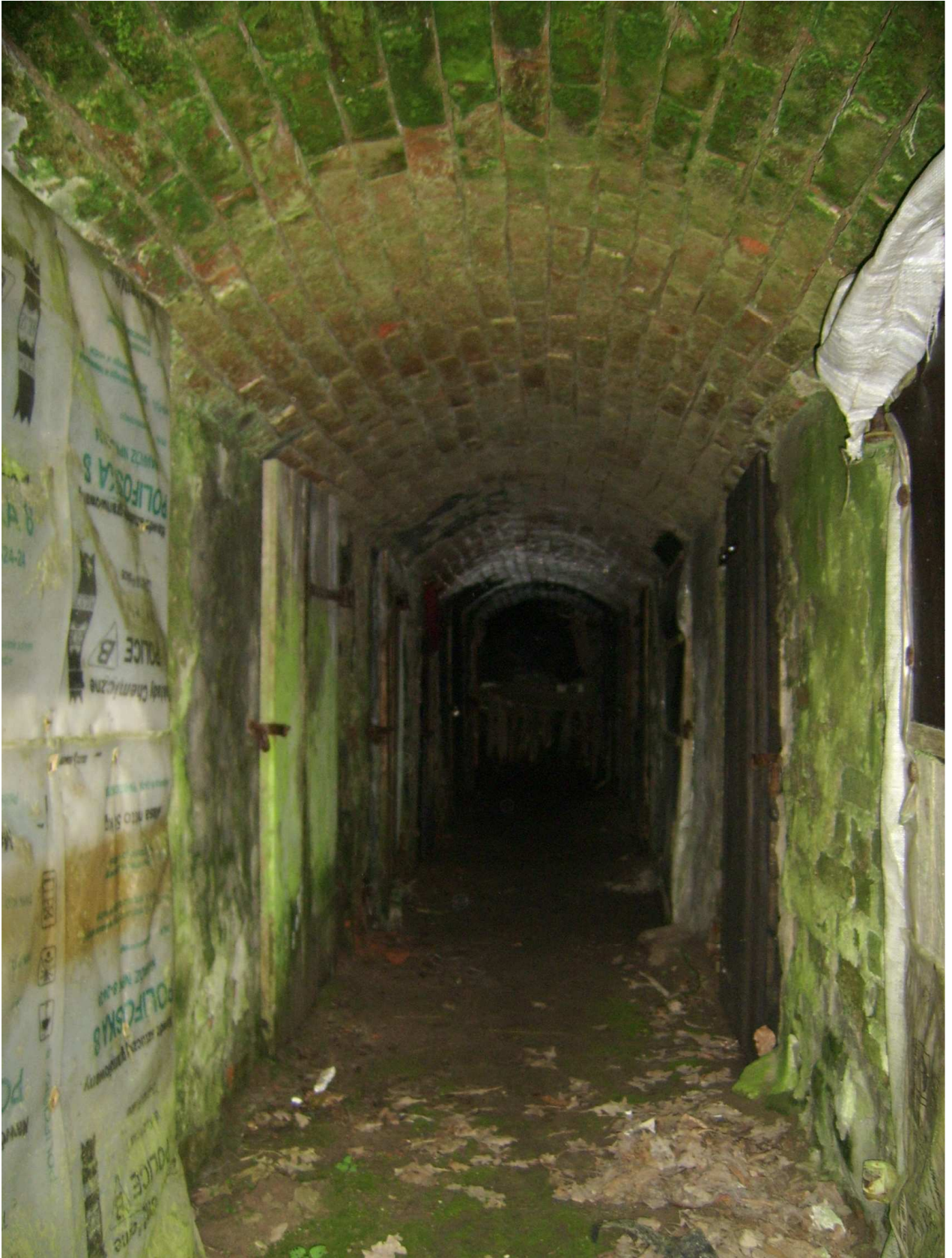
Ryc. 6 Obiekt nr 27