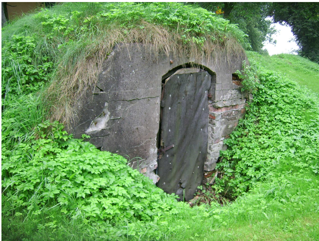
Ryc. 3 Obiekt nr 22