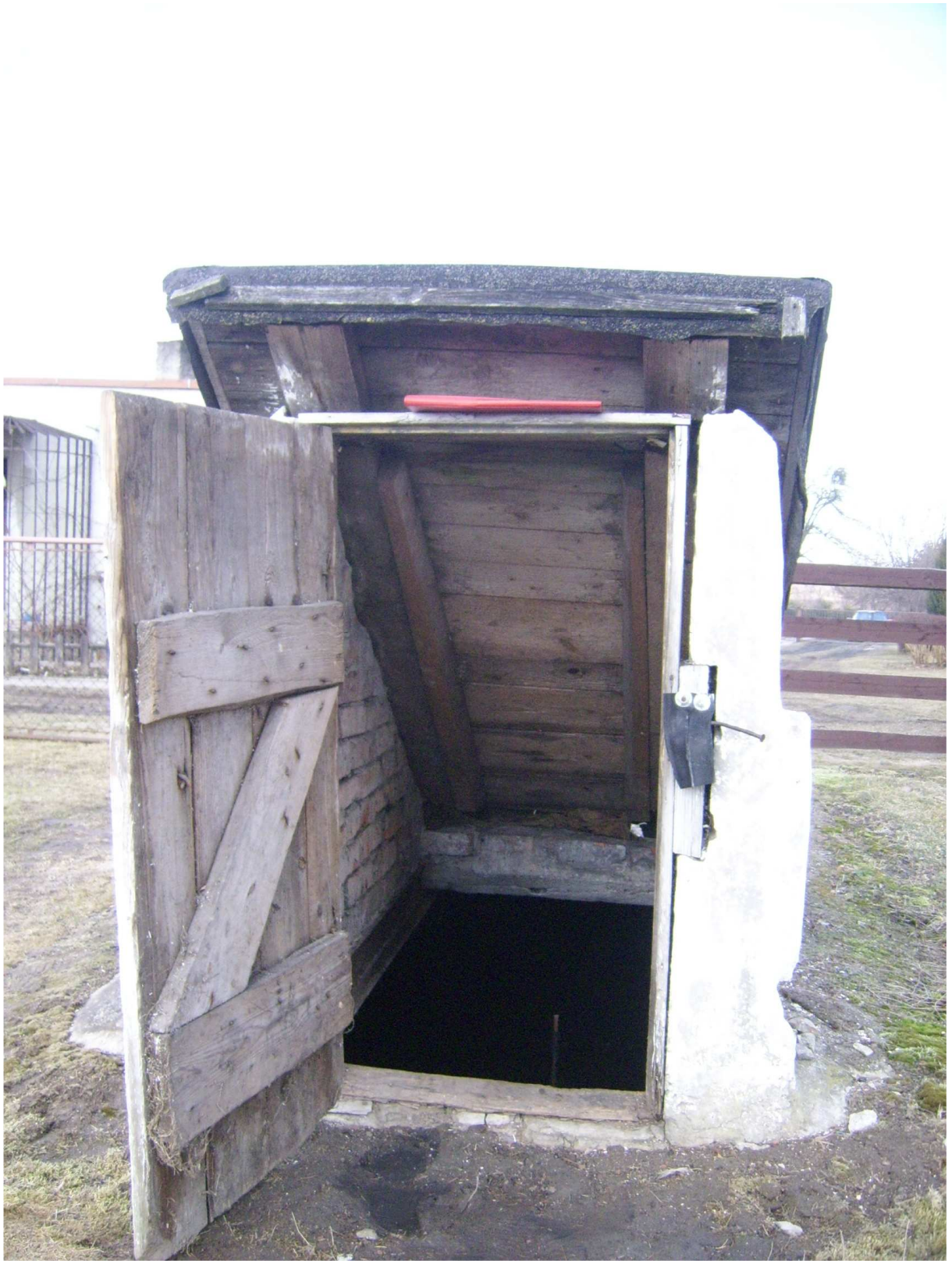
Ryc. 10 Obiekt nr 3