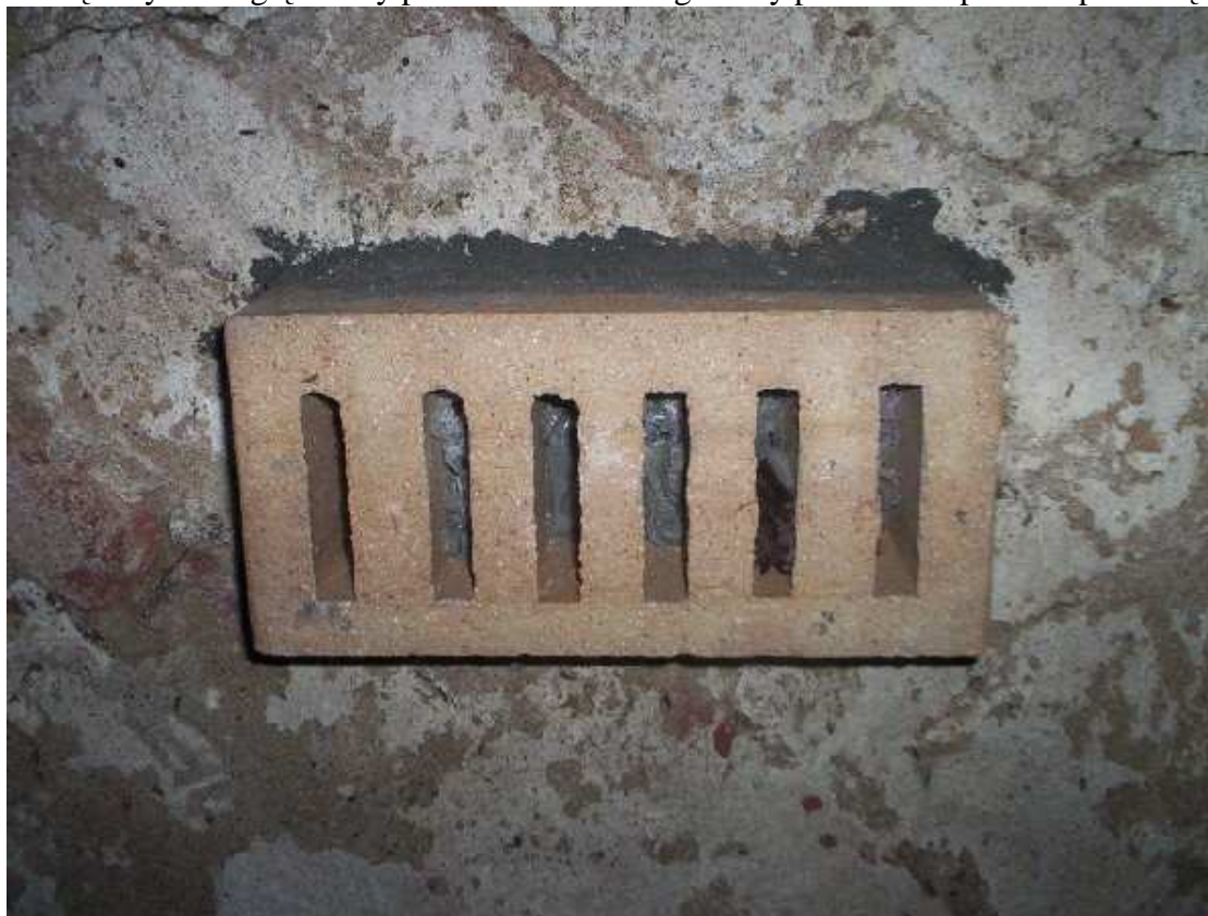
Ryc. 1 Sposób montażu cegły do stropu.