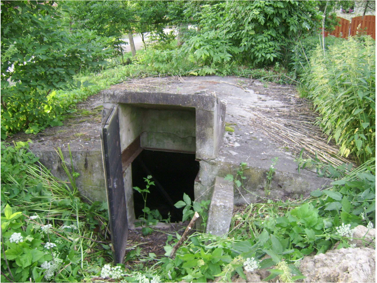
Ryc. 8 Obiekt nr 50