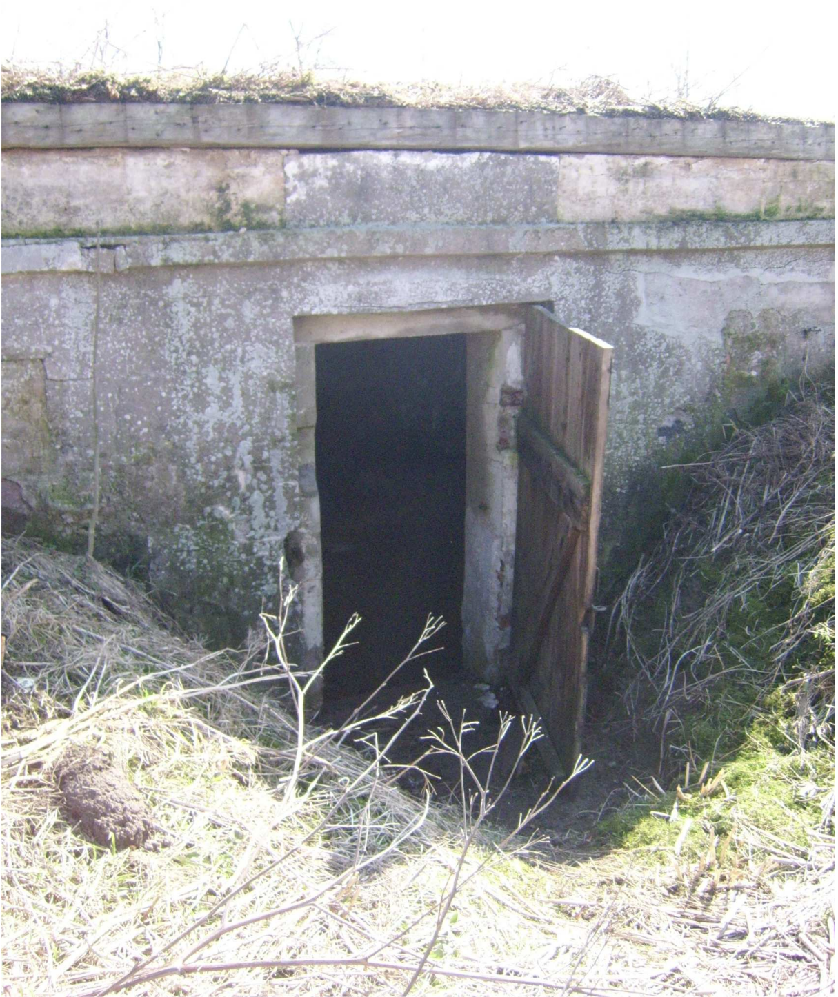
Ryc. 14 Obiekt nr 20