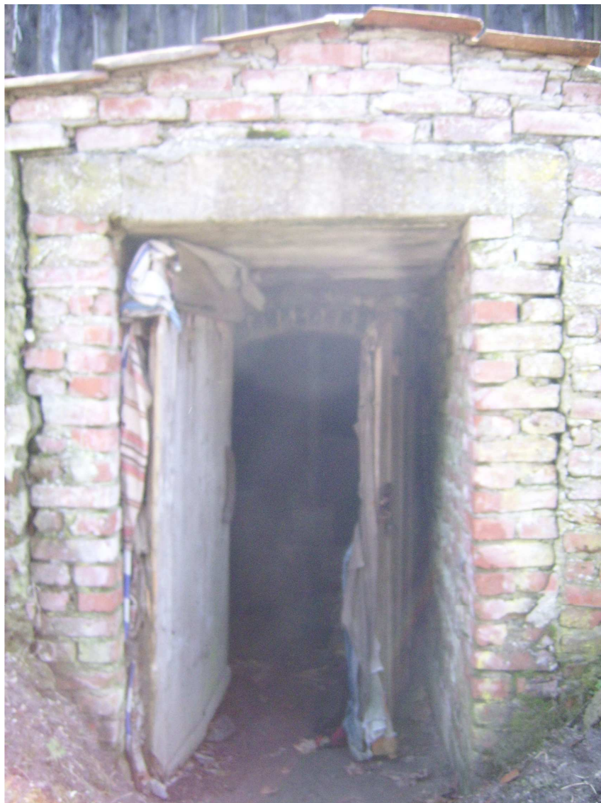
Ryc. 4 Obiekt nr 23