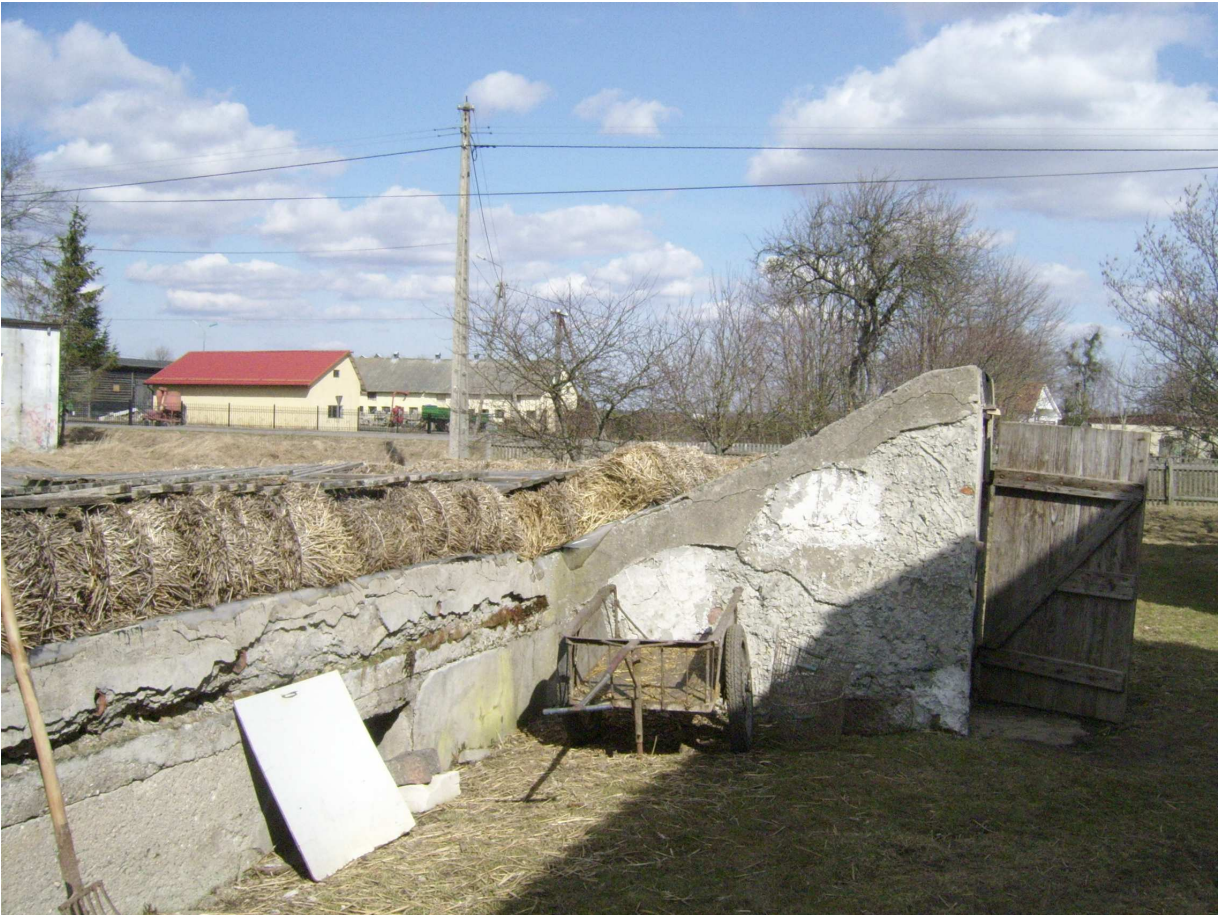
Ryc. 9 Obiekt nr 1