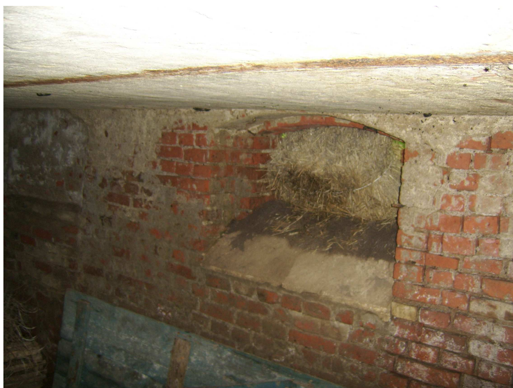
Ryc. 5 Obiekt nr 25